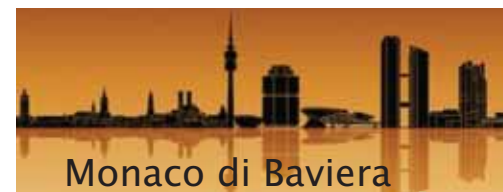
Monaco di Baviera